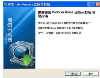
圖 2.2 《還原免疫盾》安裝畫面

在《還原免疫盾》歡迎使用安裝畫面中(圖 2.2，閱讀「軟體許可證協議」畫面中的全部訊息內容後，點選「我接受協議合約中的條款」，便可按「下一步」，再根據提示完成安裝。