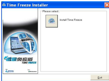
圖 2.1 《還原免疫盾》安裝畫面

安裝前建議你關閉所有其他應用程式。將《還原免疫盾》安裝光碟放進電腦光碟機便會自動執行安裝程式，如沒有自動執行安裝，可進入「我的電腦」，雙按光碟機的代號，打開光碟機的內容，雙按 Setup 程式進行安裝。(圖 2.1)